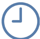
Reloj de control de asistencia